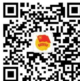
“宝鸡青年” 微信公众号