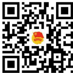
“宝鸡团市委” 新浪微博